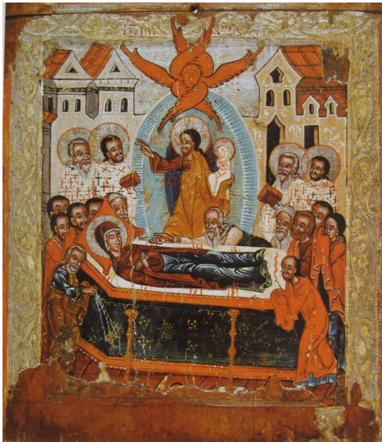
Icon of the Dormition of the Theotokos, Kalush, Ukraine – late 16 th Century.

Слава Ісусу Христу! Glory to Jesus Christ!