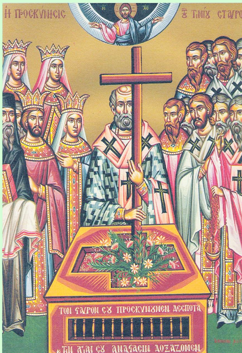
Icon of the Veneration of the Holy Cross